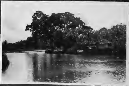
جيرة مدينة في (الخالع) يقصدها التذعرت صباح كل احد وهما عظيم آلات وادوية وفي اشجارها نبات من الترواح