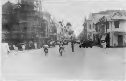
أحد شوارع بغداد الجاهلية (عراقنا) وفيه بعض المباني الكبيرة تعود إلى الحمانيين . ومع ذلك، فهو ميدان السماء سره .