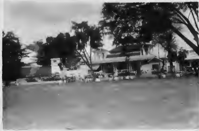
المسجد الجامع في (الخالع) ويقع في كبد البلاد