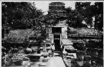
مقبرة قديعة بقرسى (جاوا) ولها باب عظيم وبها آثار كتابة عربية على امض القبور تدل على من دفنوا بها من عظامه الرجال .