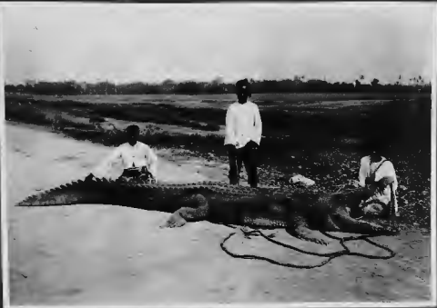
تساج قد تمكن من القبض عليه القار من الجاويين وسعدوا به الى البر .