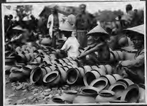
سوق التتيرال المارني