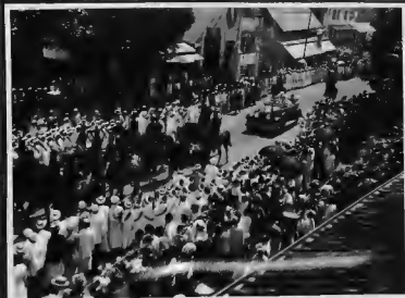
موكب الوالي العام الجديد حين زيارته مدينة سورابايا وقد اصطف تلامذة المدرسة الخيرية العربية بلباسهم الرسمي امام الجمعية الخيرية للاشتراكهم بقية الجاليات في الاستقبال