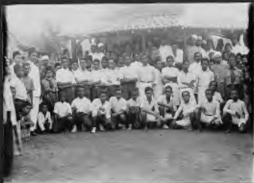
فرقة الرياضة في كرة القدم وكلل اصحابها من ابناء العرب وبنات الفرقة تعرفه بطرقة (الصفا).