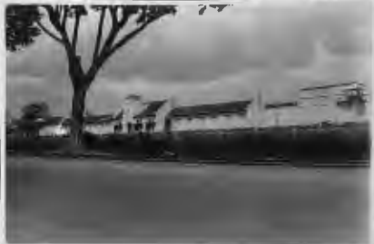
سجن مدينة (الخالع) ومع كونه سحيا فإنه يقع في بقعة من أحسن بقاع (الخالع)