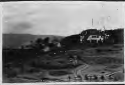
ماترو في (الرائع) يشرف على حدائق غناء وهي مملأة بالزواجل الزهور.