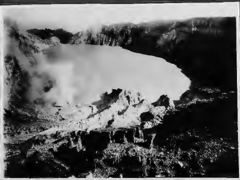
بركان من براكين جاوا في الجهة الغربية منها ويرى التاقر فوهته الكبيرة يتصاعد منها الدخان .