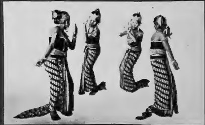
طايفة من الممثلات الجاويات يقمن بدور التمثيل ومن مادة أمرأه جاوا القسلي بالنظر الى الممثلات وهن على هذه الحال .