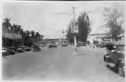
شارع (فارس بسار) الشهير وفيه أكثر دور السينما والمحكمة العليا . وفوقه يمر القطار على الجسر الذي يقطع خط الترامواي .