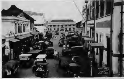
شارع (عراقنا) من الجهة الغربية ببغداد . وفي الوسط ترى إدارة سعادة محافظ العراق .