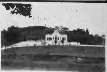
هوتيل جميل في مدينة (الرائع) عمالاً يقع على هضبة سندسية ويشرف على مناظر طبيعية تأخذ بجاذب القلوب.