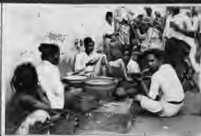
بعض العمال الجاد من بين البطلة في منتصف النهار يتناولون طعامهم من خمس الباديات في الشوارع .