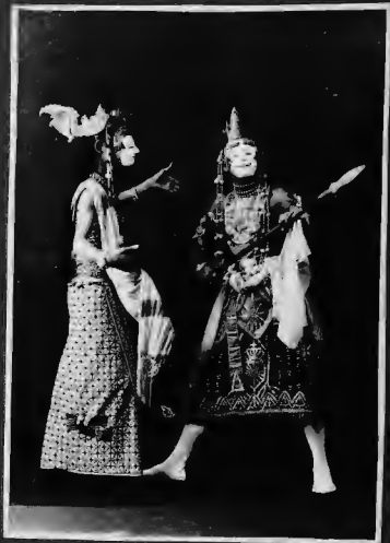
منظر من مناطق الجزر الجاوي - ولجاويين شتف