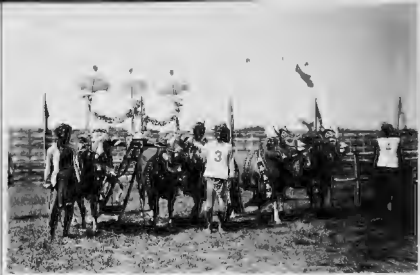
منظر من مناظر سباق البقر بجاولا وهو منظر البقر حين دخولها الميدان . ويجلس المدورا على الخوصم ولوع عظيم هذه السابعة .