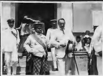
سلطان مدينة الصولو مع سادة المحافظ بسورايا حينما قدم لزيارتها وهو يدهي في القلعة الجاوية (سونن صولو).