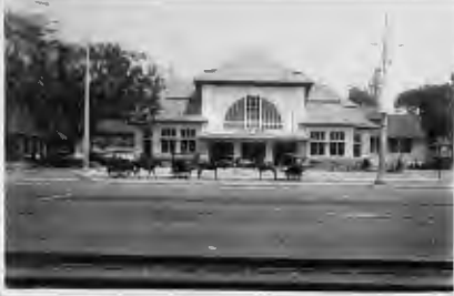
بوسطة سور بابا الجديدة