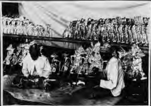
جملة صور ممددة للبيع وهي صور التتيرال المارني حينة ويتكلا ويقال لها (وايد كوايت).