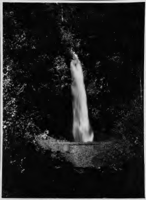
شلال من شلالات جاوا يسكب ماء زلالا . ويقع في جبل (رونديو) بالقرب من مدينة المانع ويرتفع عن سطح البحر بـ ٦٠٠٠ قدم .