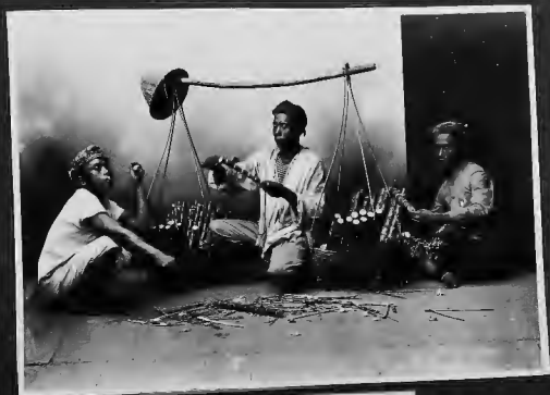
قصب السكر متعلما بطرف به جاوي ليبيج .