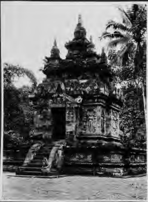
معبد أنري بوذي بالقرب من بودو بودور وقد بني كله من الحجر الكبير الصلابة فقط. وبداخله تمثال عظيم جدا. واغرب ما فيه قبته التي بنيت بالاحجار الضخمة بكل دقة واتقان.