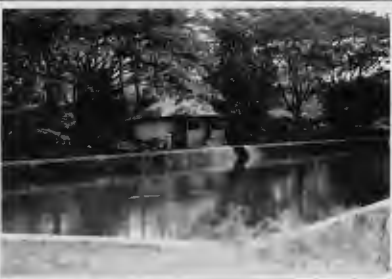
جاية كبيرة في (الاراع) نسي (سومبر فوروم) وفيها عين نائمة يقصدها البليل للاغتسال .