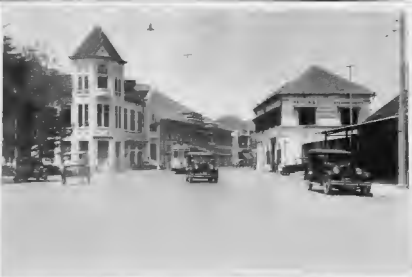
شارع (عراقنا) ببغداد وفيه بعض المباني الهامة .