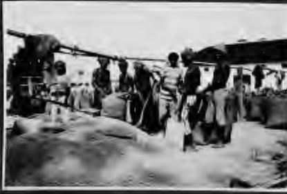
حال سوقين للأروين الكياس يمدح حاصلات جاوا