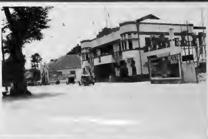
احد دور السينما بسور بابا وهو في مواقع الافراح الملهمة ولان ان يشاه غير م . ويسمى (سينفـ تياتر) .