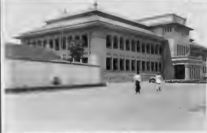
قصر الجبيرة التجارية الموحدية السورية (هناك مقر بلدية دمشق) وهي تقبض على زمام الكثير من معالم السكر الكبيرة .