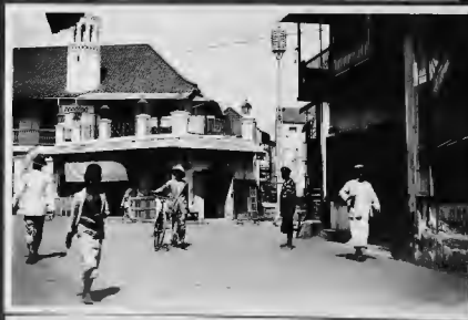
مسجد الصريح يتوارع العرب في مدينة سورابايا ووقمه بين عمالات الاتجار الحضرمية ويكتص بالملايين يوميا .