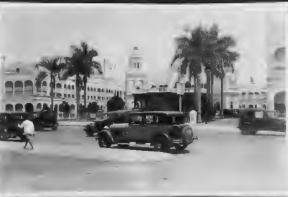
(أورنجي هورتيل) وهو الخبز نزل بسور بابا وفي اخر شارع مستكمل الاثاث والادوات والاوزام ، تؤده الطبقات المترية وتمتد فيه الحفلات الراضة .