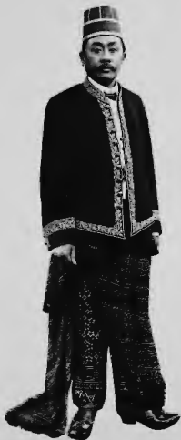
احمد امراء جاوا بلباسه الرسمي ويسمى عند الجاويين (وخيت) اي امير البلاد واليه ترجع بعض مسائل الدين .