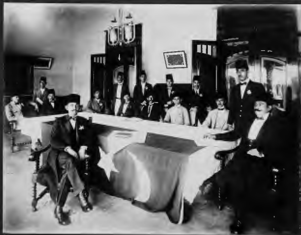
اعضاء مجلس ادارة جمعية من ابناء الاخوان لسوريا الجاوا