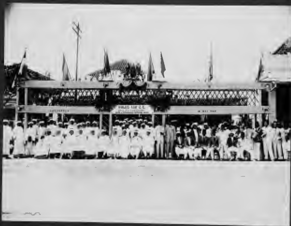
اعضاء جمعية من اعاد الاشراف يستقبلون الوالي امام جمعيتهم حين زيارتهم في 1914