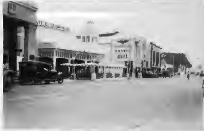
قهوة من مقاهي سوريا (توتو حان) واليا محل من محلات تجارة الاروين الكبار .