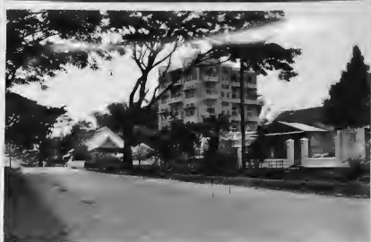
مشروع يتكون من طبقات لأحد المسيحيين في مدينة (الرائع) التجارية هو أحياء الليل ويؤمها الناس للاستشفاء والراحة.