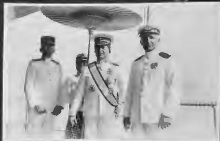
سلطان مدينة جكجا وبجانيه رئيسا الورشة البحرية بسورايا ووراه خادم