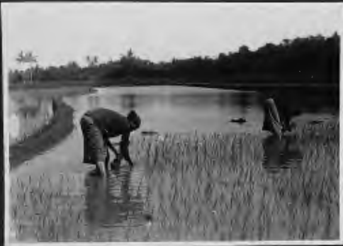
مزارعة من مزارع الأرز بجاوا .