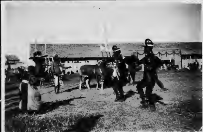
البقر السابعة يتقدم بها صاحبها لتسلم الجائزة من اللجنة المراقبة المؤلفة من قبل حكومة البلاد . ويقام السباق مرتين في السنة .