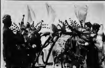
البقر الخائزة لقصص السباق وقد حليت صفورها بألوان الزيتية . وأرسلها بزرورن ، اعلمون ، ويتشرون اشمار الجملة والتعمر .