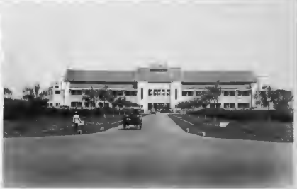
مبنى الكلية بسور بابا وقد اكتمل بنظام جديد. وترى امامه عربة من عربات انجيل صائرة نحو القصر.