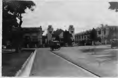
غلايس هوتيل في مدينة (الرائع) بجوار وهي تبعد عن سورالما بـ ١٠٠ كيلومتر. وانفس قطار مياه السنت بالشرق من الماء.