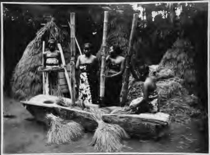
بعض النساء الماويوت من يسكن الضواحي والقرى يشارن العراج الأوز من قشورها بالطريقة العادية القديمة، ويكسفن بهذا اللباس غالباً ما دهن في البيوت وفي أوقات العمل.