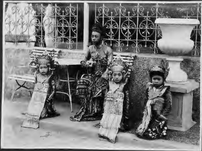
ملك جزيرة البالي بلباسه الرسمي وبجانبه ابنتاه الصغيرتان وبالطرف الايمن خادمة البنتين . وجزيرة البالي هذه من جملة المستعمرات الهولندية وتمهد عن مدينة سورابايا بمسافة ليلة واحدة في الباخرة .