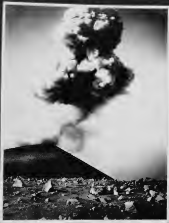
توهة بركان من براكين جاوا وهي تنفث دخاناً هائلاً حين هباجة.